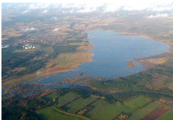
Bølling Sø genskabt i 2004